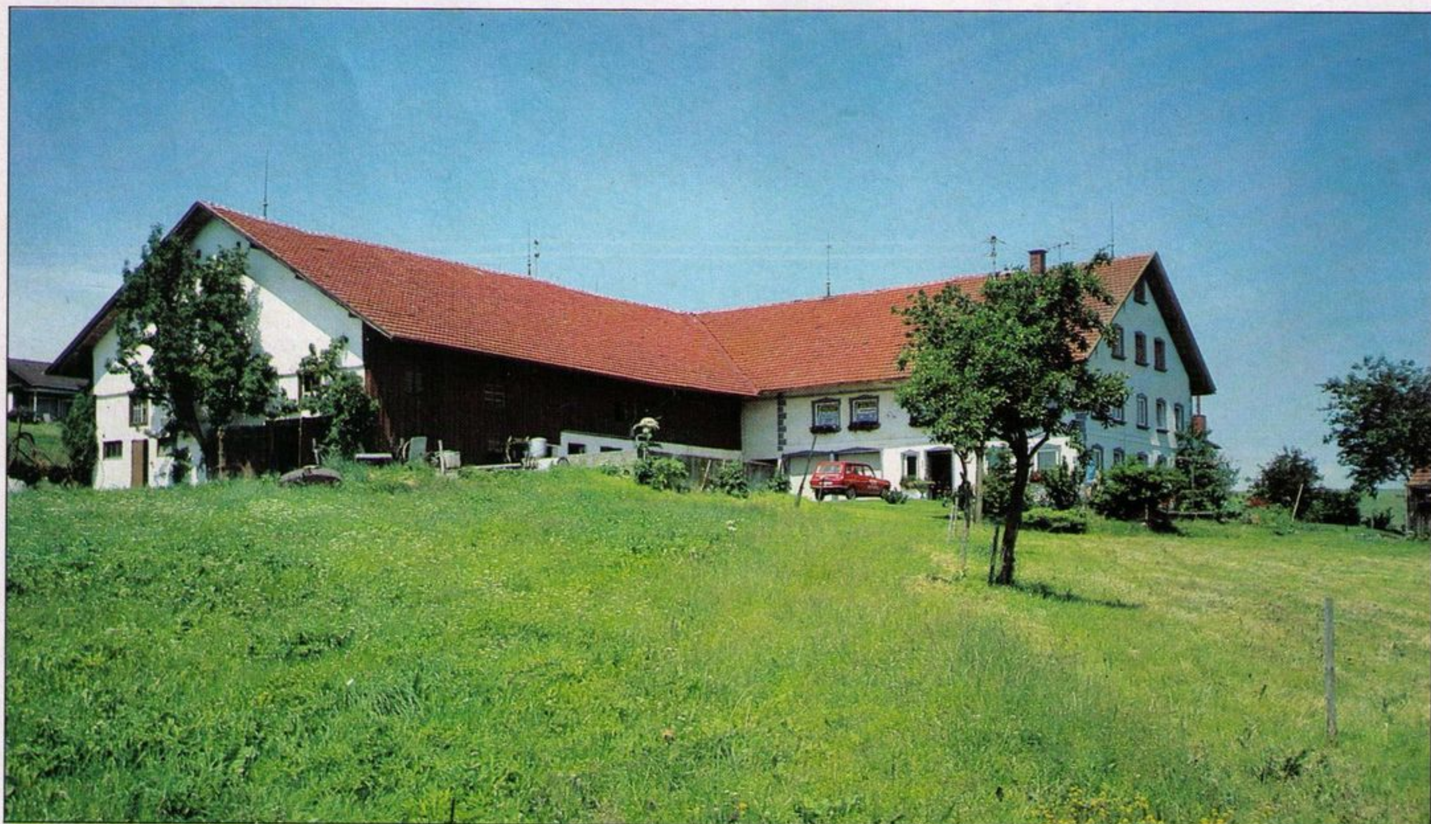
HiFi-Idylle in Altusried: Scheune (links), Wohn- und HiFi-Haus (rechter Teil)

Im ersten Stock des Wohntrakts prangen große Aufkleber der vertretenen HiFi-Anbieter. Hier laden drei Studios zum Staunen ein. Eine nied-